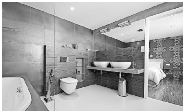
Koupelna je chytrě propojena s ložnicí

Ačkoli se obecně tvrdí, že pro bydlení nejsou půdy vhodné (obecně jsou určeny k jinému účelu, pod zkosenými střechami se špatně pohybuje), architektka Radka Zedníková touto realizací dokázala, že i z půdy se dá vytvořit moderní, vzdušné a pohodlné bydlení.