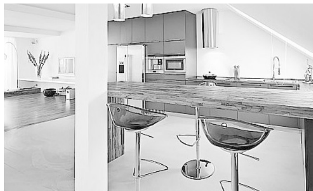
Prostory spojila teplá průmyslová mozaika